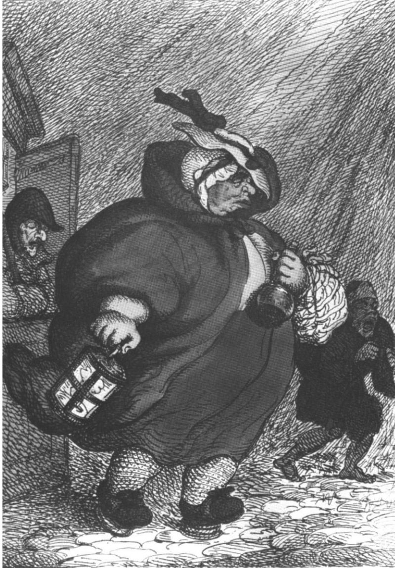
Een vroedvrouw bij nacht en ontij op pad

In deze tekst vindt U een reconstructie van de ziektes, ongemakken en bedreigingen die het vrouw-zijn in vroeger tijd raakten.